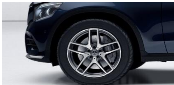
Llantas de aleación AMG de 48,3 cm (19") y 5 radios dobles color gris titanio