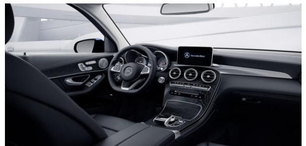
Molduras de madera fresno negro de poros abiertos