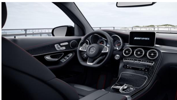
Molduras de madera fresno negro de poros abiertos