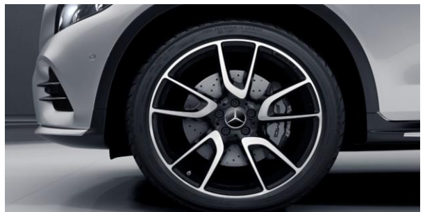
Llantas de aleación de 21" y 5 radios dobles color negro de alto brillo y pulidas a alto brillo, delante: 255/40 R21 con 8,5J x 21 ET 40, detrás: 285/35 R21 con 9,5J x 21 ET 22 (684)